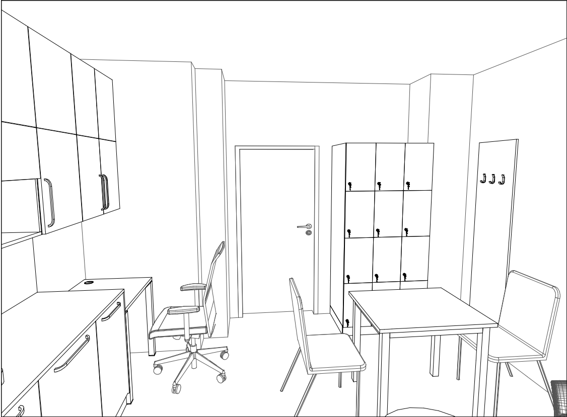
místnost číslo 286 - denní místnost